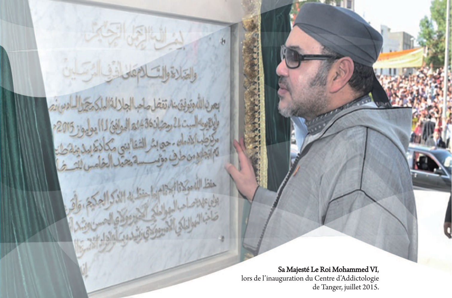
Sa Majesté Le Roi Mohammed VI, lors de l'inauguration du Centre d'Addictologie de Tanger, juillet 2015.

“...Il serait donc inacceptable de considérer la jeunesse comme une charge pour la société. Elle doit, au contraire, être traitée comme une force de dynamisation du développement. Il est donc impératif de mettre au point une stratégie globale qui mettrait fin à la dispersion des prestations fournies actuellement à notre jeunesse, et d'adopter une politique intégrée qui associe, dans une synergie et une convergence, les différentes actions menées en faveur des jeunes. ”