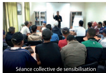
Séance collective de sensibilisation