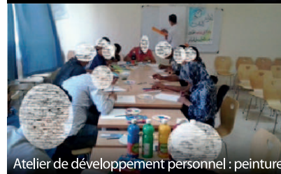
Atelier de développement personnel : peinture